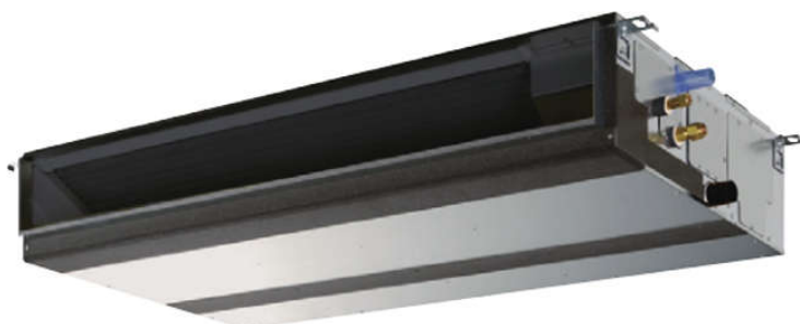
PEAD-M JA → Drain pump built-in

Η σειρά αποτελείται από δύο τύπους, τα μοντέλα με ή χωρίς ενσωματωμένη αντλία αποστράγγισης.