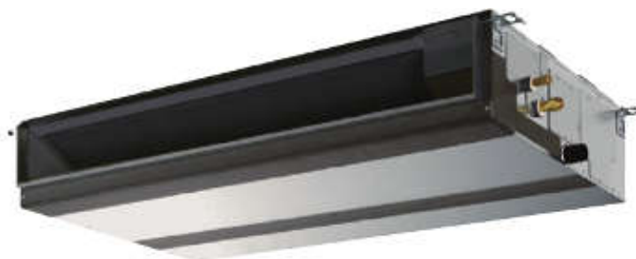
PEAD-M JAL → No drain pump

* Units with an "L" included at the end of the model name are not equipped with a drain pump.